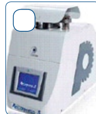
INGLOBAMENTO CAMPIONI METALLOGRAFICI