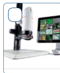
MICROSCOPIA STEREO MICROSCOPIA DIGITALE