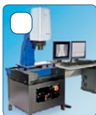
MACCHINE 3D MULTISENORE