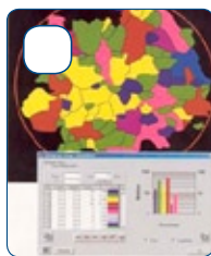
SOFTWARE PER MISURA E ANALISI D'IMMAGINE