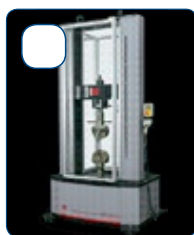
MACCHINA PROVA MATERIALI