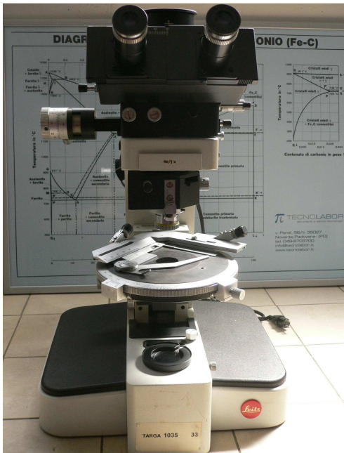
Immagine dello strumento descritto

Inoltre il sistema è completo di analizzatore girevole, lamine \lambda e con tavolino girevole 360°. La testa binoculare è munita di terza uscita per l'applicazione di telecamere analogiche e digitali così da poter documentare le osservazioni al microscopio.